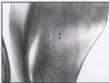
わざと付けた穴があいたようなキズ