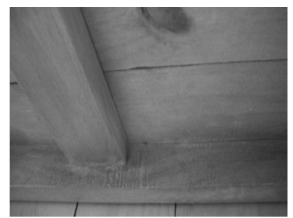
裏面の塗料のはみ出し、キズ、カケ