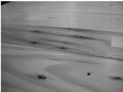
釘穴痕（建築材と使用していた証）