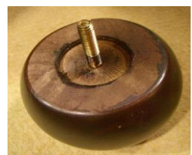
取り外し可能な脚例