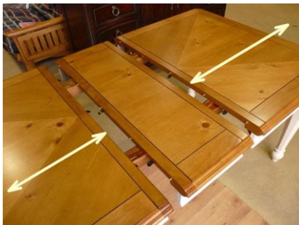
テーブルのスライド

エクステンション裏面に左画像のフックがございます。 ご使用時は必ずフックを固定しお使い下さいませ。