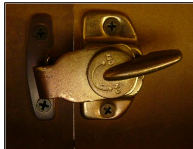
フックが斜めの状態

下の画像はフックが斜めにかかっている状態です。 この状態で、テーブルを移動したりすると、事故などにつながる場合がありますので、フックはしっかり固定してください。