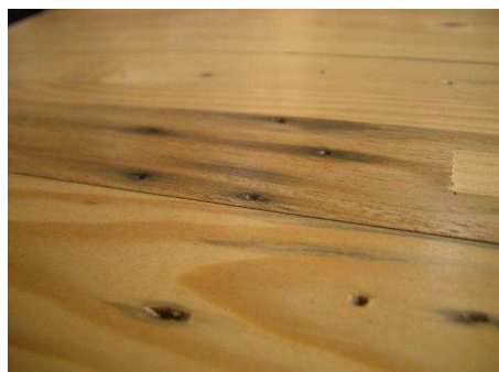
釘穴痕（建築材と使用していた証）