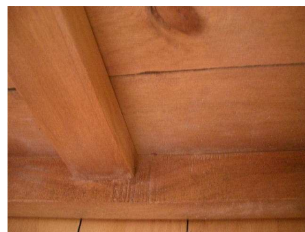
裏面の塗料のはみ出し、キズ、カケ