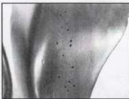
わざと付けた穴があいたようなキズ